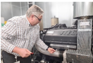
Ihre Perspektiven bei uns!